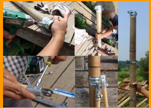
竹テント部材の加工・取付